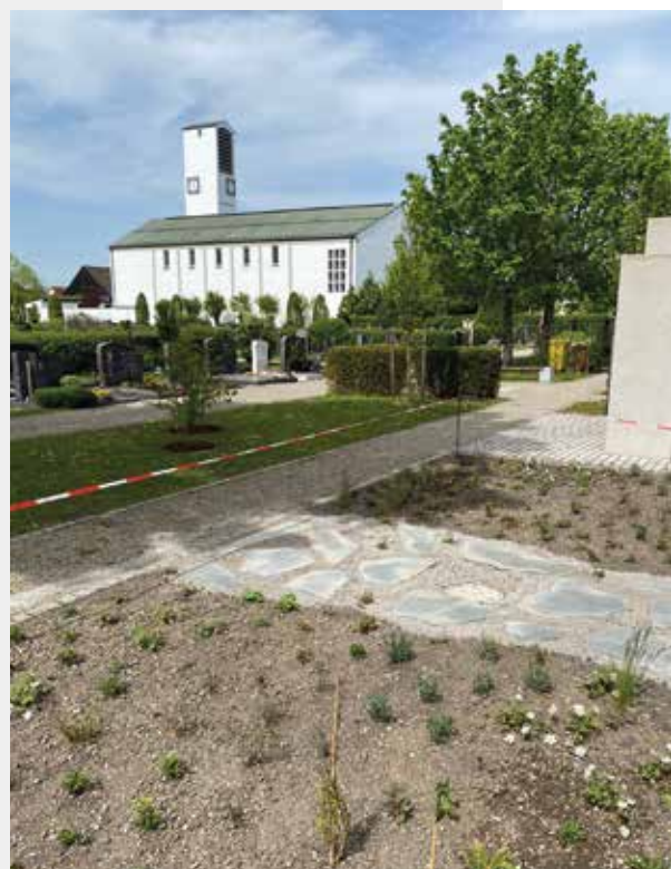
Schon fast fertig ist die neue Anlage auf dem Friedhof. Die neue Stehle wird vom Steinmetz noch fachgerecht angebracht.